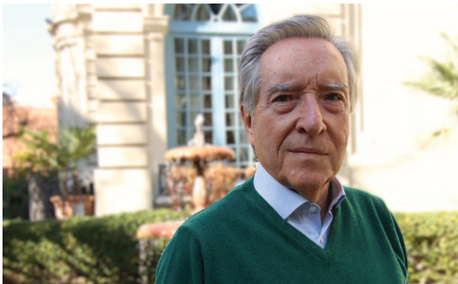
Imagen de archivo | FARTVE