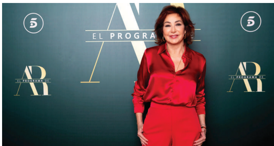
Ana Rosa Quintana