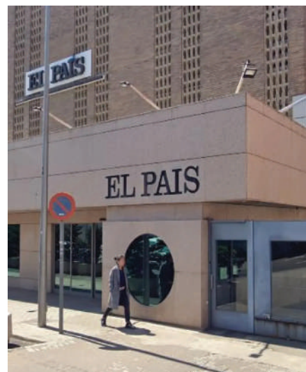
Sede de El País | Prisa

Fundado en 1976 , EL PAÍS ha sido protagonista de algunos de los hitos informativos más relevantes de la historia reciente, posicionándose como una de las principales cabeceras generalistas del país. Las celebraciones del aniversario tendrán presencia en ciudades como Madrid y Cartagena, así como en citas culturales internacionales como la Feria del Libro de Guadalajara, reforzando su vocación iberoamericana y su compromiso con un periodismo riguroso y de servicio público.