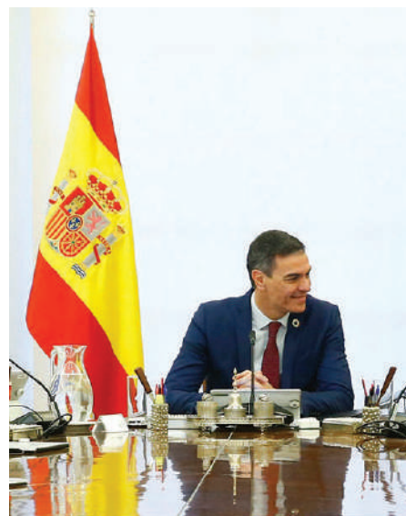
Pedro Sánchez